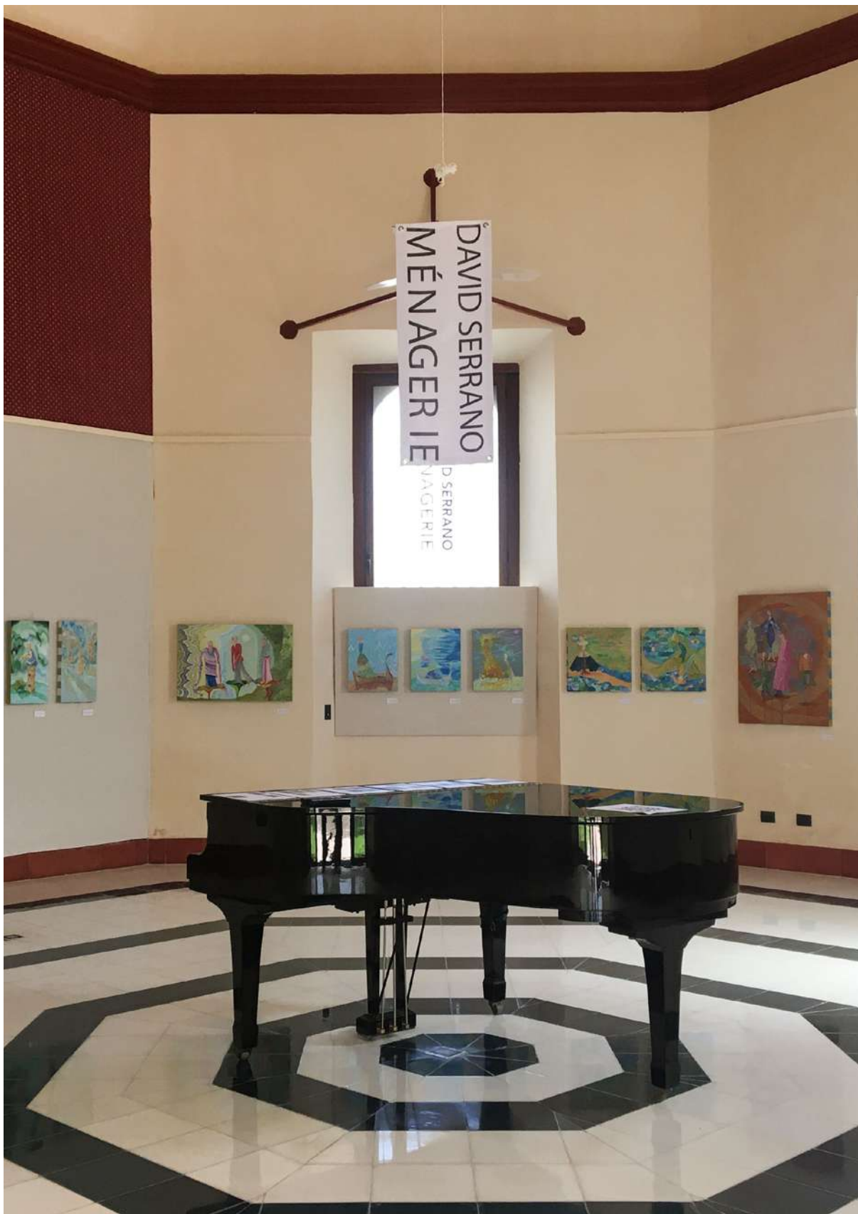
Título: Ménagerie. Artista: David Serrano