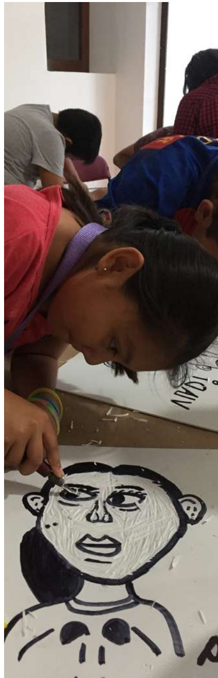
Taller infantil de grabado