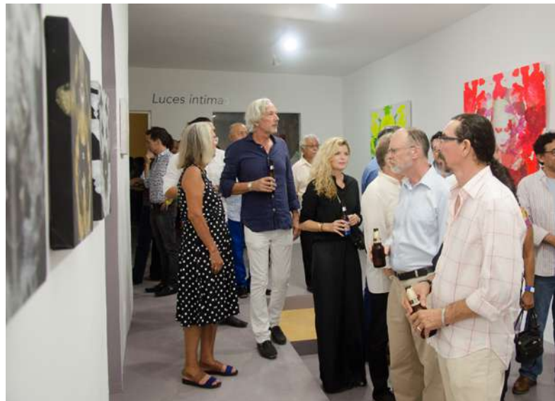
Inauguración de la exposición Luces íntimas de Kimiko Yoshida © CCC 2015.