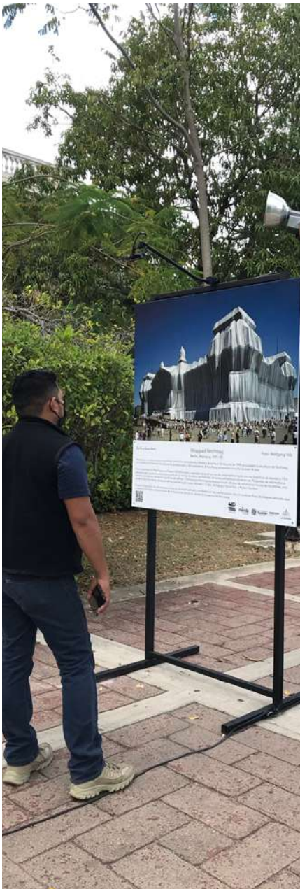
Exposición Christo y Jeanne Claude por Wolfgang Volz © CCC 2022.