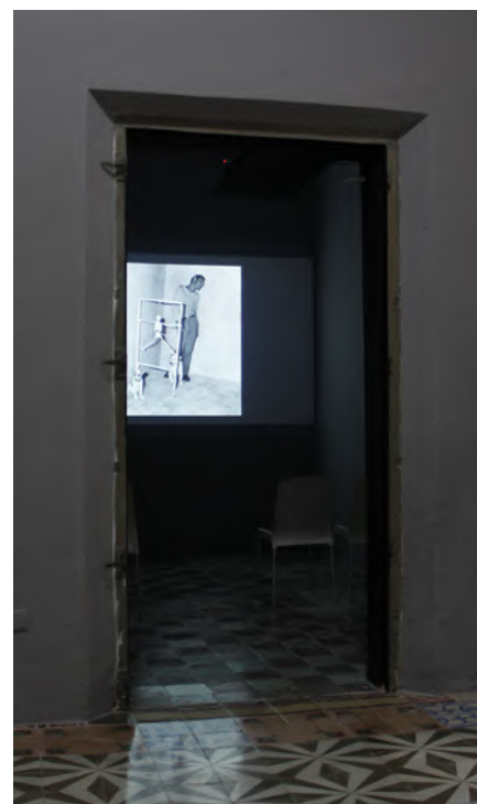
Proyección de Roger Ballen.

"Cada vez que es posible, los artistas se reúnen con el público, con la finalidad de fomentar un vínculo entre los creadores y los espectadores".