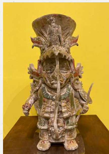
Chaac, 2022 Resina policromada Colección privada

En 2022, diez años después, la serie encuentra otra vida en el Gran Museo del Mundo Maya de Mérida. No se trata de esculturas crípticas ni cerradas, sino al contrario, son formas abiertas que pretenden encontrar siempre nuevas relaciones o dinámicas, como en este caso la relación entre ellas mismas, o con las piezas de ORLAN que las preceden. Aquí, las piezas encuentran un sentido nuevo y eso me entusiasma mucho.