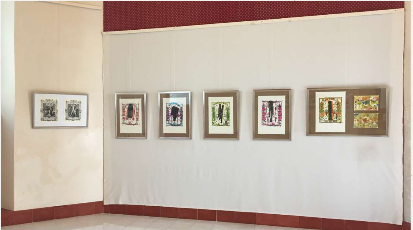
Vista de sala, obra de Demián Flores. Exposición Múltiples, Fundación Centro Cultural la Cúpula, 2022.

Además de la exposición en el museo, en la Fundación Centro Cultural la Cúpula se exhibe una serie de piezas gráficas. ¿Qué le dirías al público que visita tu exposición?