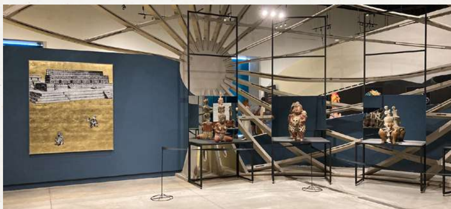
Vista de sala, obra de Demián Flores. Exposición Hibridaciones, Gran Museo del Mundo Maya de Mérida, 2022.

De/construcción de una nación fue una serie originalmente realizada para el Museo Nacional de Arte (MUNAL) en 2012 y, diez años después, se presenta en el Gran Museo del Mundo Maya de Mérida. ¿Qué significa para ti exponer tu obra en este museo, junto con piezas de la gran artista francesa ORLAN?