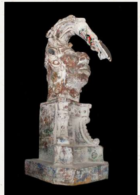
Maya, 2013 Cerámica policromada Colección privada © Demián Flores

En la exposición que está en la Fundación la Cúpula quise mostrar gráficas que inciden sobre la tradición, mostrando una diversidad de técnicas. Son de diferentes épocas y series y permiten tener una visión amplia de mi quehacer gráfico.