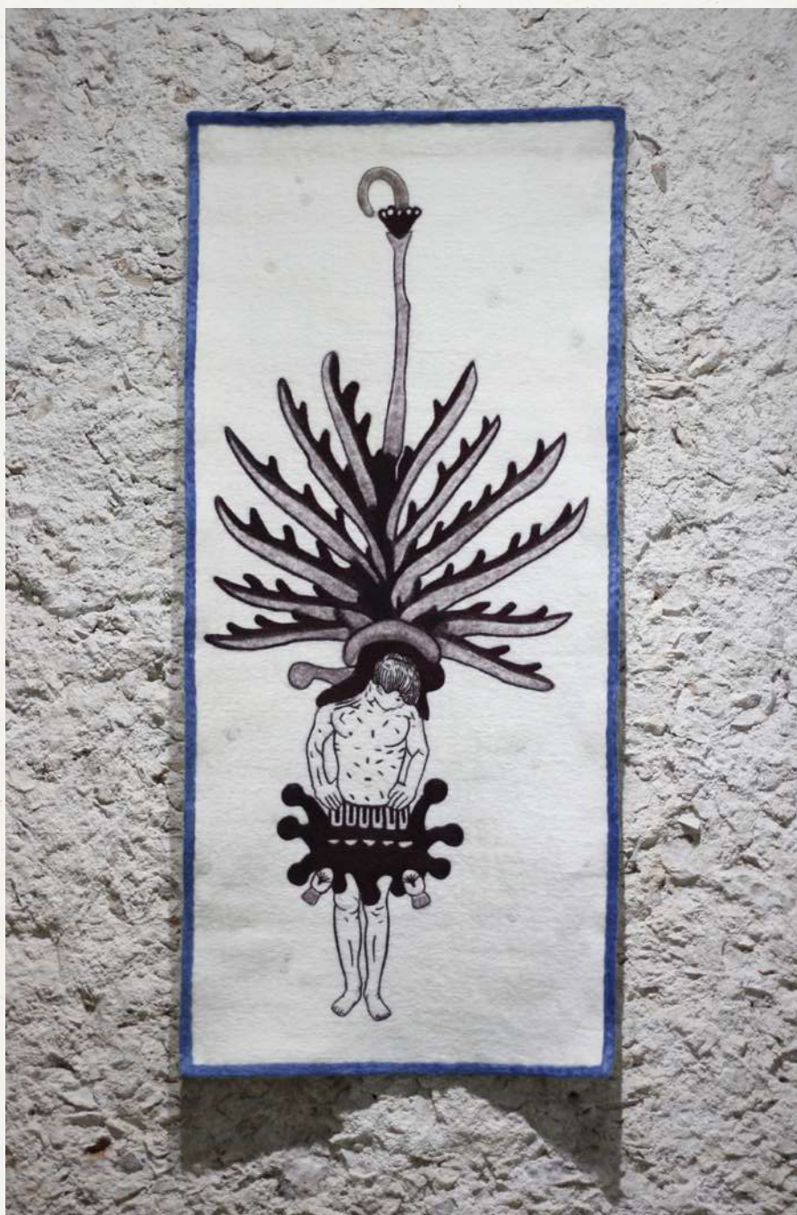
Mezcal, 2013 Tapiz afelpado Colección privada

La exposición Hibridaciones está visible en el Gran Museo del Mundo Maya hasta el 7 de mayo de 2023. La exposición Múltiples se puede visitar en el Centro Cultural la Cúpula de lunes a viernes, únicamente con cita al correo: lacupulamerida@gmail.com .