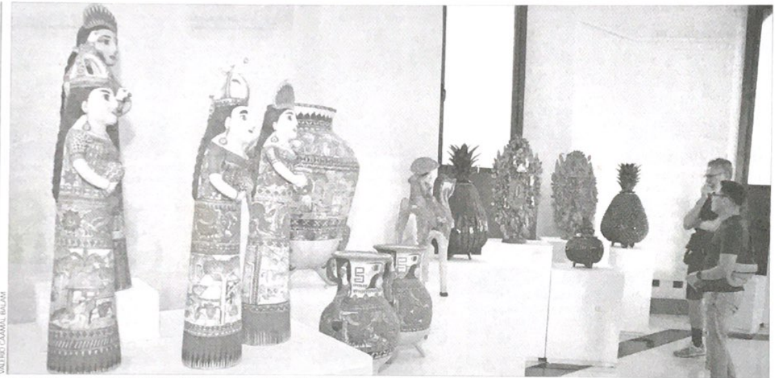
Productores de diferentes regiones del país, entre ellas Yucatán, están representados en "Grandes maestros del arte popular mexicano", que ya se puede visitar en La Cúpula

La directiva destacó que en la muestra hay artículos para todos los gustos, desde los confeccionados con madera,