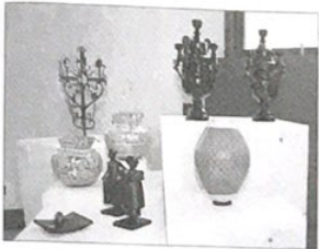
FOTOCOPIA DE VALERIO CÁDIZ